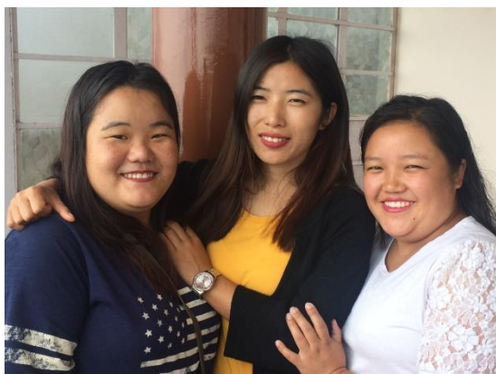
Kinzangkit, Nimphuti, Laymit